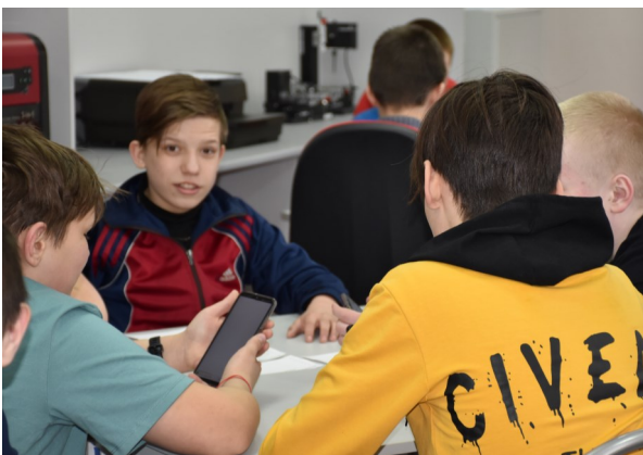
Команда мальчиков 7 класса «Молния Маквин»

Но это еще не всё. Нас ждет вторая игра «Битва умов» мальчики против девочек среди 8-10 классов.