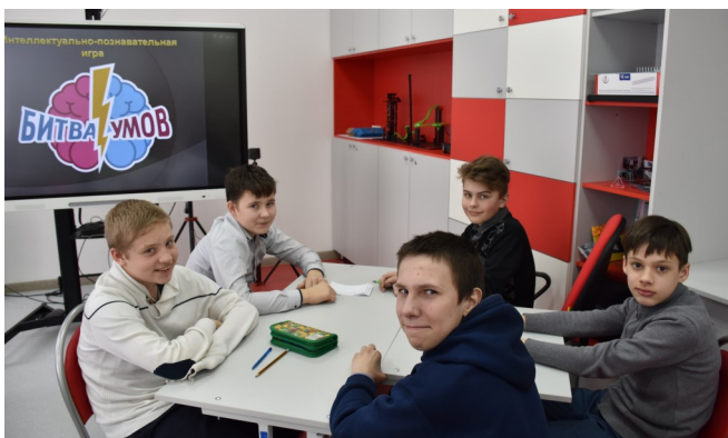
Команда мальчиков 6 класса «Пираты соломенной шляпы»